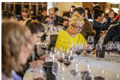
Dans la salle

N.B. - Sur la photo du haut de page : une photo de Faïte rouge et blanc accrochée au Monastère.