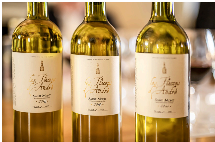
Les 3 bouteilles "Les Flacons d'André" (2010, 2011 et 2014)