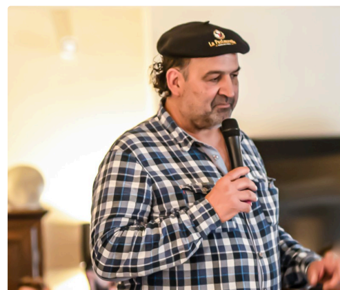
Intervenant en salle sur l'accord Roquefort-Saint Mont