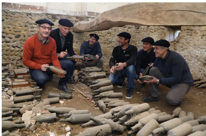
Bouteilles enterrées retrouvées à Saint-Mont

Pour le blanc , c'est l'assemblage n°4 qui est retenu par les parrains, qui lui reconnaissent une parfaite expression du terroir du Saint Mont. Une robe pâle aux reflets verts, un nez ouvert et juteux de pampleousse rose, des parfums d'herbe coupée, une verticalité (acidité) exceptionnelle, des arômes uniques d'agrumes etc. : un très grand millésime de Faïte blanc.