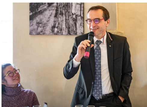
Intervention dans la salle