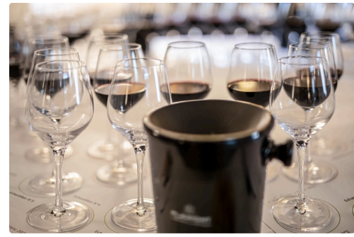
1 Gros plan sur les verres de dégustation 1bis 140322.jpg