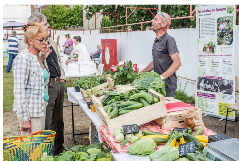
Stand du Jardin sur un marché