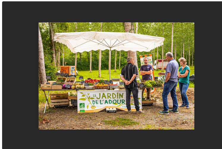
Portes ouvertes demain samedi 19 mars au jardin de l'Adour à Cahuzac-sur-Adour

Début d'une synergie avec d'autres producteurs locaux