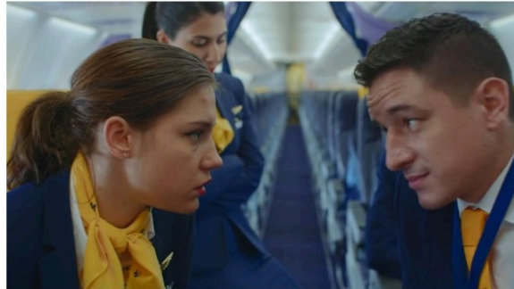
Portrait d'une jeune hôtesse de l'air avec "Rien à foutre" au cinéma mardi soir