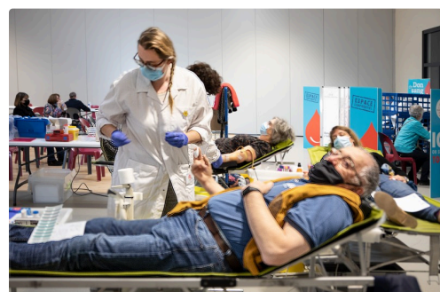
3 Donneur 1bis 210322.jpg