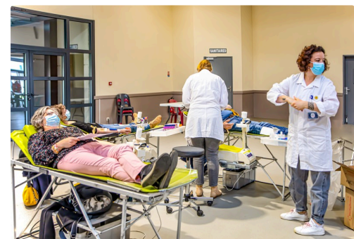
2 Deux donneuses bénévoles 1bis 210322.jpg