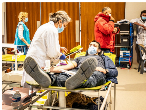
0 DSNA 1 donneur en action 1bis 210322.jpg