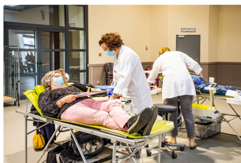
4 Autres donneurs.jpg