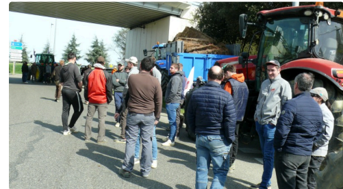
Moment de pause.