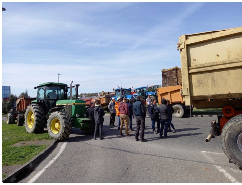
Une partie des JA 32 au rond-point des Justes.