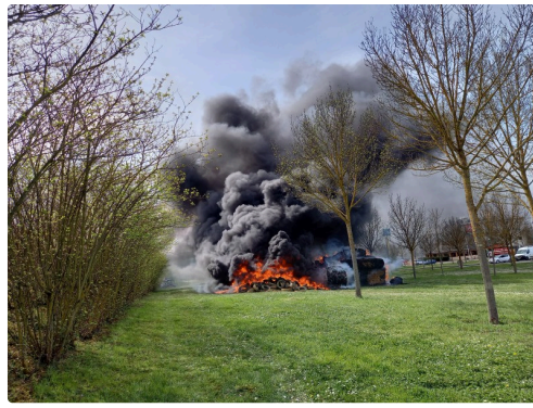
Le feu de la colère.