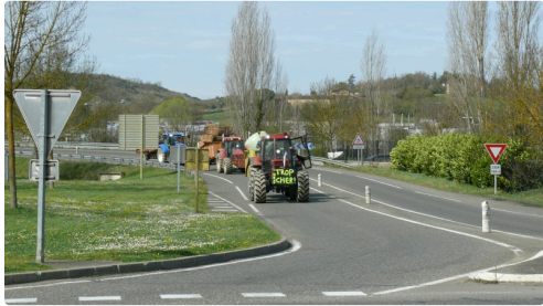
Arrivée des manifestants depuis la 2X2 voie.