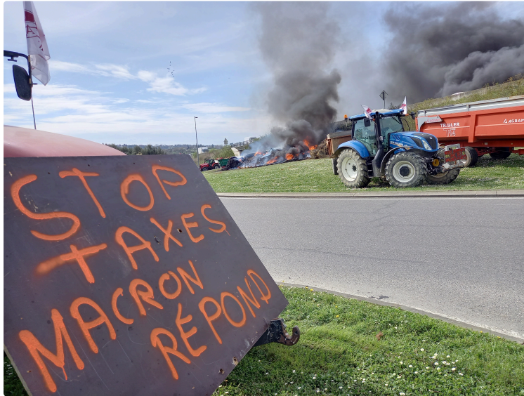
Les Jeunes Agriculteurs ont parcouru la ville

Comme prévu les Jeunes agriculteurs avec leurs tracteurs, remorques et à coup de klaxons, se sont retrouvés ce mardi 22 mars en fin de matinée sur le rond point des Justes à Auch. Les uns arrivaient de Gimont et les autres de Saint-Poutge, lieux du rassemblement pour mettre en place l'opération escargot.