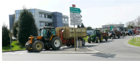
Arrivée des manifestants depuis la rocade.