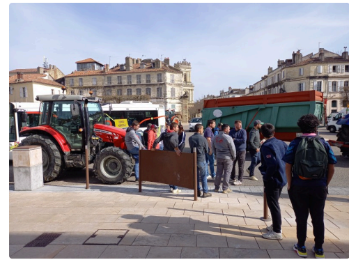
Place de la Libération.