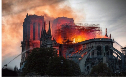
"Notre Dame brûle" au cinéma samedi soir en présence des sapeurs-pompiers volontaires vicois !

A 21 h samedi , Cine Qua Non vous propose Notre-Dame brûle de Jean-Jacques Annaud avec Samuel Labarthe, Jérémie Laheurte, Chloé Jouannet, Pierre Lottin, Élodie Navarre