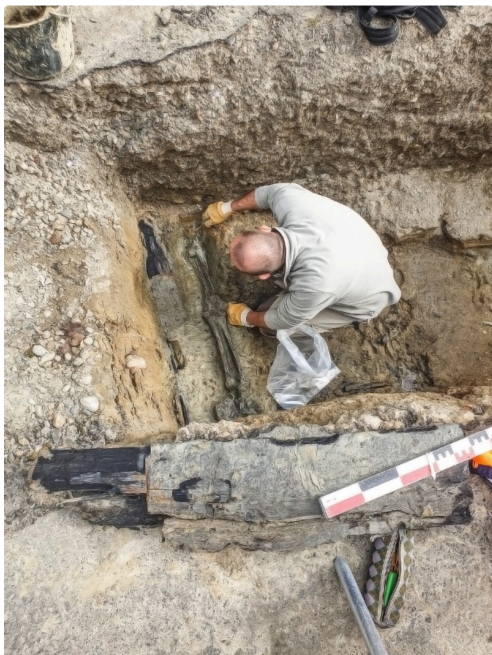
L'archéologue au travail