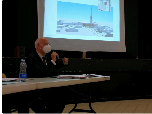
Marciac la Créative