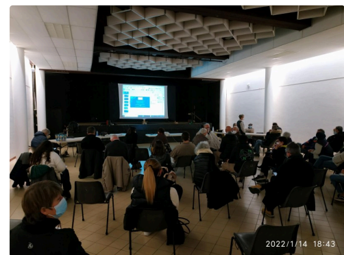
réunion de janvier 2022