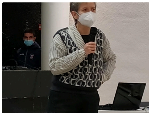
projet de MEDIEVAL ADFP Marciac