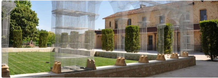
Marciac la Créative !