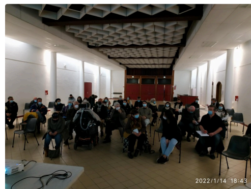
marciac la créative comité de pilotage