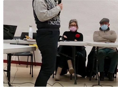
présentation de Marciac la Créative