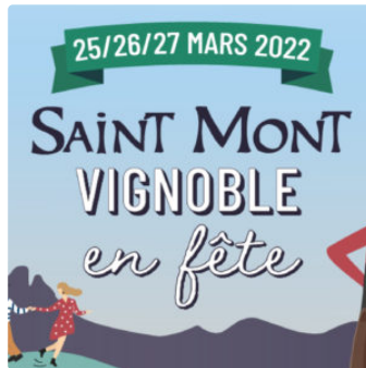
La Villa Saint-Mont en fête à Marcillac.

Bar à vins et boutique éphémère au 9 rue Henri Laignoux