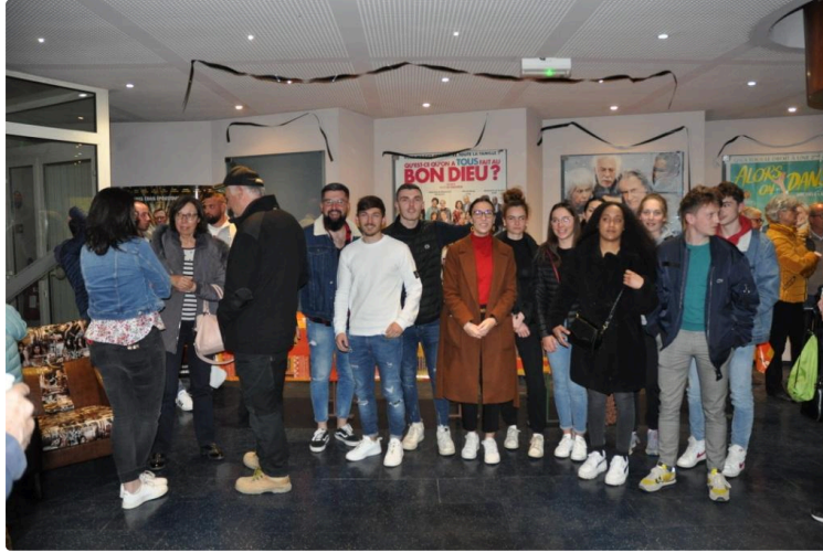
"Notre Dame brûle" vu par les pompiers volontaires de Vic

Samedi soir, Cine Qua Non diffusait Notre-Dame brûle de Jean-Jacques Annaud, un film qui reconstitue heure par heure l'in vraisemblable réalité des événements du 15 avril 2019 lorsque la cathédrale subissait le plus important sinistre de son histoire et qui montre comment des femmes et des hommes vont mettre leurs vies en péril dans un sauvetage rocambolesque et héroïque.