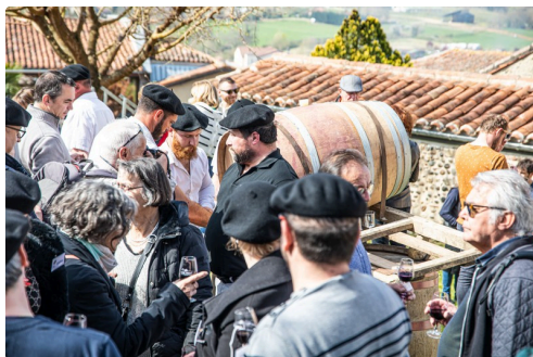
Cohue près de la barrique