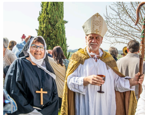
Un "évêque" et une "religieuse" n'ont pas manqué la fête