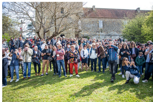
4 Les spectateurs 1bs 260322_.jpg

Bref : une belle journée dans un grand beau temps annonciateur du printemps.