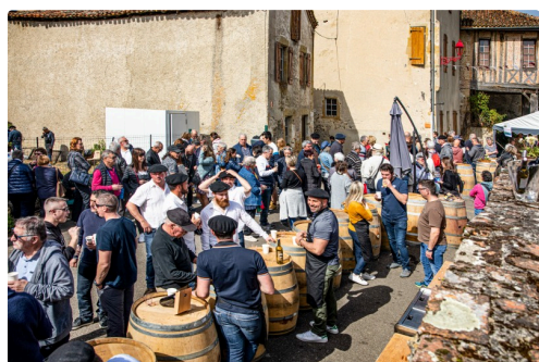
Dégustation dans la rue à Saint-Mont