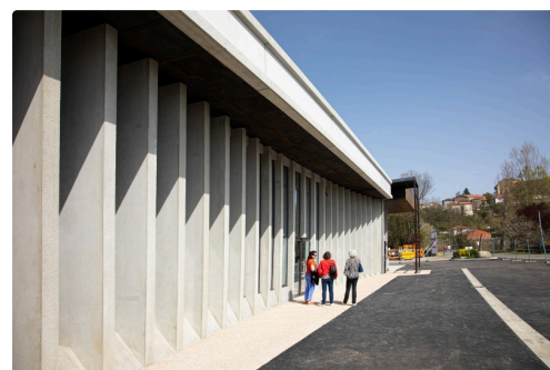
Façade du nouveau chai expérimental