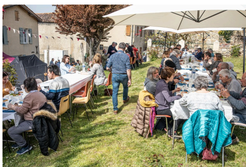
Déjeuner aux tisons dans Saint-Mont