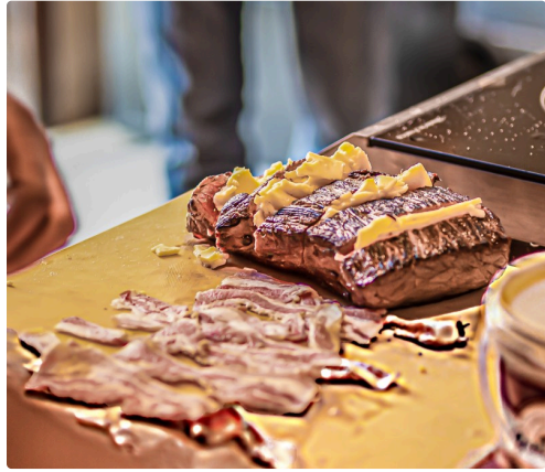
Le rôti est enveloppé de ventrèche