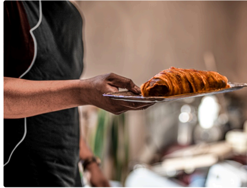
Le rôti est prêt à être mis au four