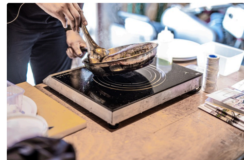
Le feu est nourri 5 mn à la cuillère avec du beurre