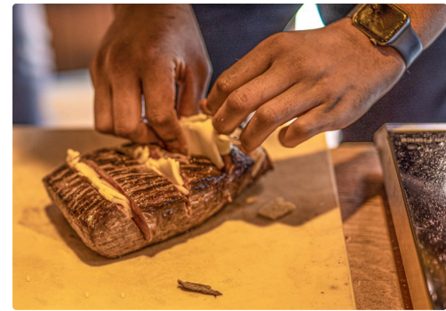
Du fromage est inséré dans les entailles