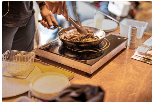
Des aromates sont incorporées au beurre