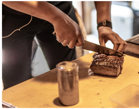
La viande est entaillée