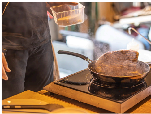
Il fait dorer la viande sur toutes ses faces