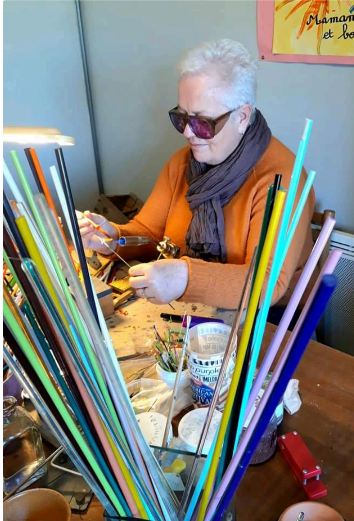
Des artisans d'art à Juillac.

Ce week-end, les métiers d'art seront aussi à l'honneur à Juillac.