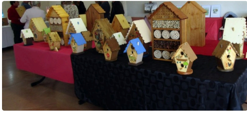
nichoirs à oiseaux.jpg

Ils vous présenteront des bijoux en verre de Murano, des accessoires de mode, des réalisations en laine mohair, des objets de décoration en papier recyclé, des bijoux fantaisies, des encadrements, des peintures aquarelles, des sacs en tissu ou encore des nichoirs à oiseaux.