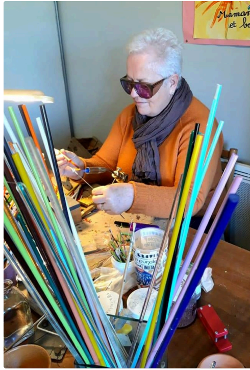
martine's création juillac.jpg