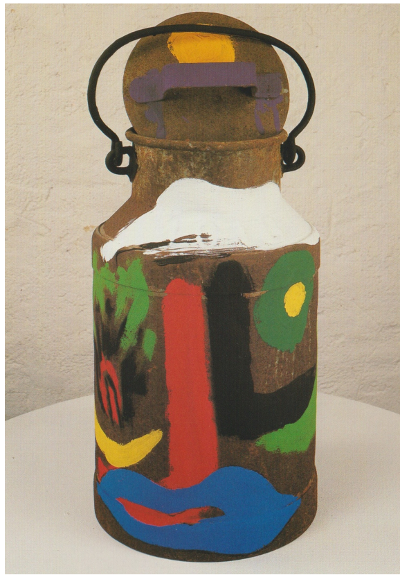
La femme au foulard blanc acrylique sur bidon de lait en fer 1990

Il voulait en effet par sa peinture à la fois séduire et signifier.