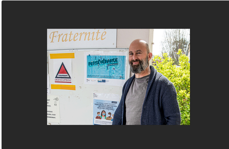
Rattraper les élèves décrocheurs du lycée de Nogaro (mis à jour le 07.04.2022)

Les reconforter, les aider à se diriger et à décider : depuis 5 ans déjà