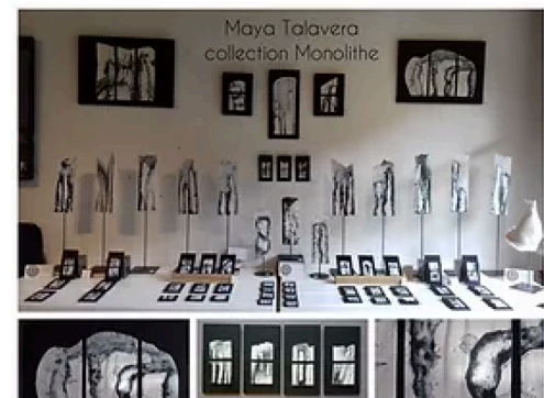
Screenshot 2022-04-02 at 13-05-13 DECORATION mayatalavera.png