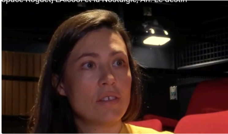
"L'alcool et la nostalgie" à l'Astrada.

Théâtre découverte : voyage introspectif à bord du transsibérien.