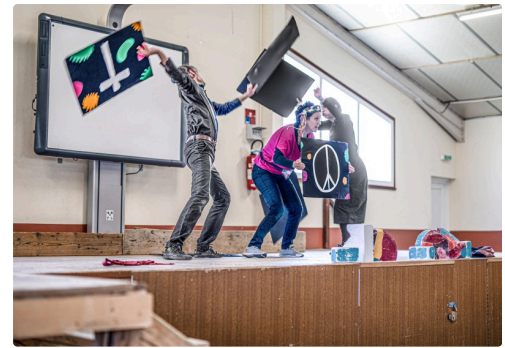
Bagarre des croyances