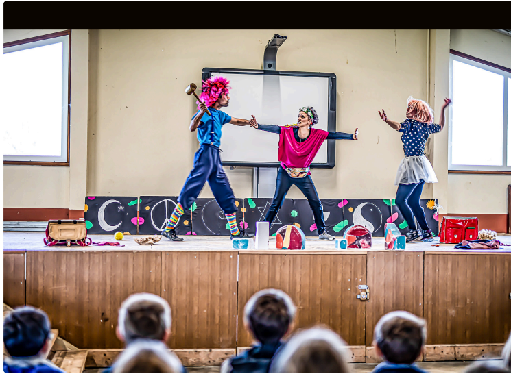
Le spectacle «Laïcité mon (petit) amour» à l'école d'Arblade-le-Haut

Les acteurs ont animé un débat avec les enfants