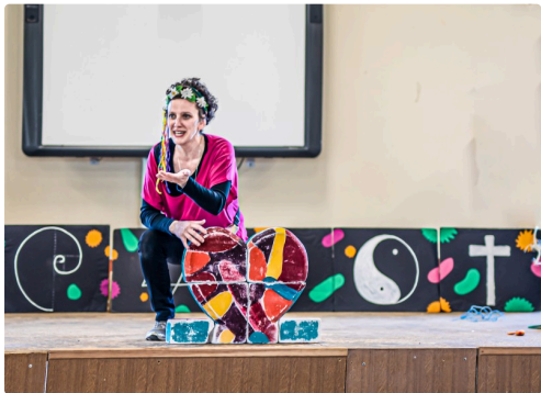
Un cœur est formé par les cadeaux comme pièces de puzzle