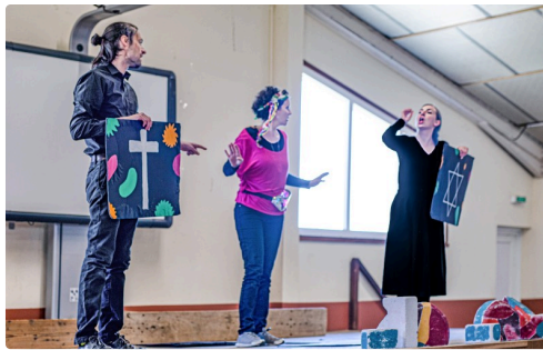
Diversité et divergence des croyances