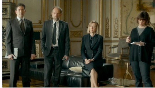
Un thriller politique d'actualité au cinéma mardi soir "Le monde d'hier"

Mardi soir à 21 h , Cine Qua Non vous propose Le Monde d'hier de Diastème avec Léa Drucker, Denis Podalydès, Benjamin Biolay, Alban Lenoir, Jeanne Rosa Elisabeth de Raincy, Présidente de la République, a choisi de se retirer de la vie politique.