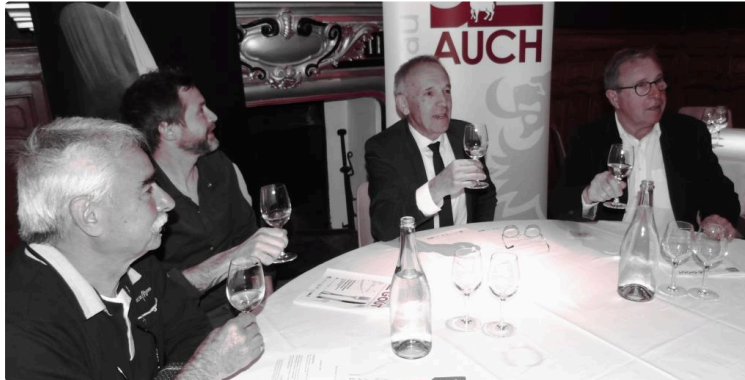
13-14 mai 2022 à Auch, première édition du festival de la gastronomie gasconne