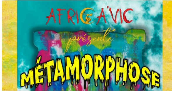
Africa Vic présente "Métamorphose" !

L'association de percussions africaines Africa Vic présente "Métamorphose", un événement qui se déroulera sur deux journées samedi 30 avril et dimanche 1er mai