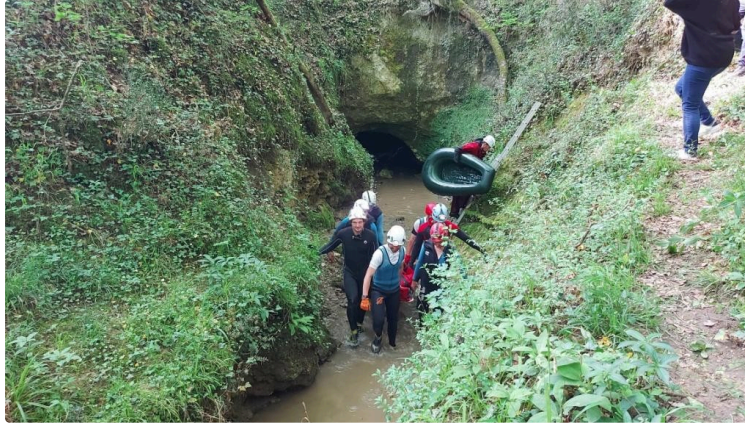
Exercice en conditions réelles de secours spéléo dans la grotte du Pont du Diable à Lannepax

Des camions de pompiers, des véhicules de gendarmerie et de secours spéléo avaient envahi samedi après-midi la place de Lannepax et le site du Pont du Diable .