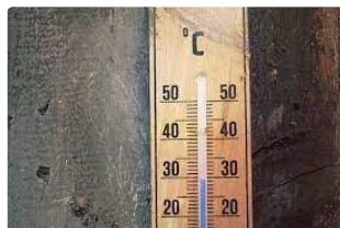
Météo : L'été arrive et vite

Les météorologues sont unanimes : Une vague de chaleur arrivera dès ce lundi en France et particulièrement sur le Sud-Ouest..