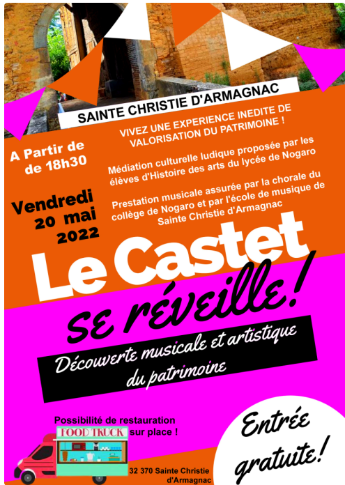
Affiche de l'événement, réalisée par les élèves