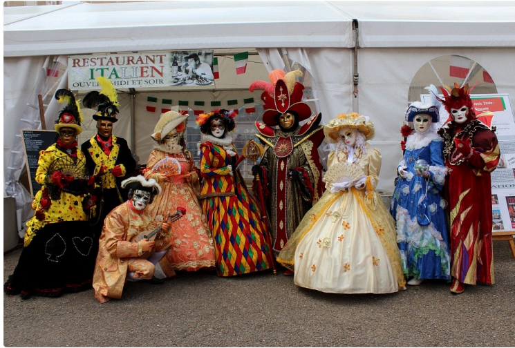
L'Italie s' installe en Astarac

Le Village Italien effectue une grande boucle à travers le Gers et à chacune de ses étapes c'est une rencontre colorée chatoyante et gourmande avec ses saveurs italiennes qu'il propose au public. Cette semaine c'est Mirande qui l'accueille