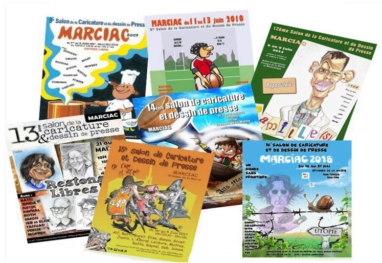
Salon de la caricature : un salon majeur du CLAP

Le 18° Salon de la Caricature et du Dessin de Presse se déroulera sur le week-end de Pentecôte du 3 au 6 juin et en amont dans la semaine précédente pour les scolaires.