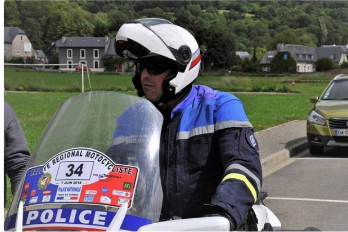
Rallye motocycliste de la police nationale

Les épreuves régionales seront gersoises