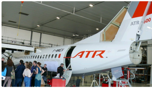
Atelier de maintenance à Franczal.