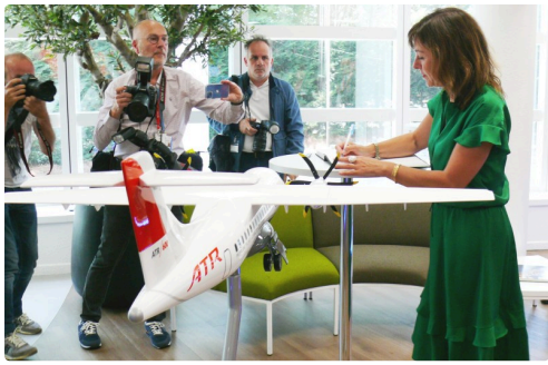
Signature du livre d'or