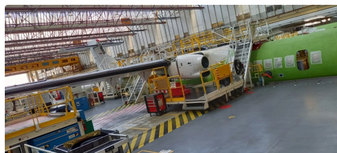
Atelier de montage.