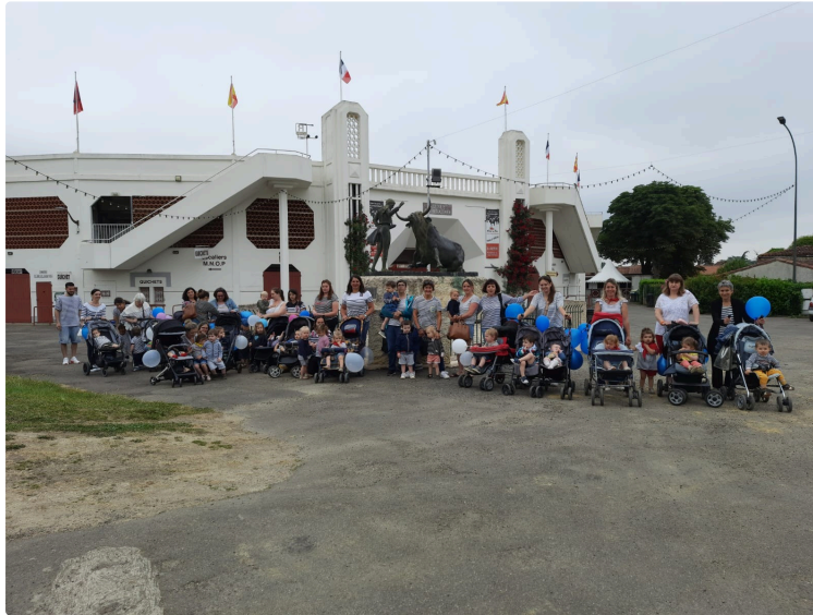
Pentecôtavic, c'est aussi pour les tout-petits !

L'ouverture des fêtes de Pentecôtavic pour les tout-petits est une animation collective qui a été proposée jeudi 2 juin par Le Relais Petite Enfance Cabriole et le Multi-Accueil La Casita .