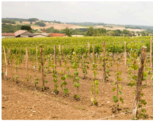
Vue de cette parcelle de suivi (25 ares)