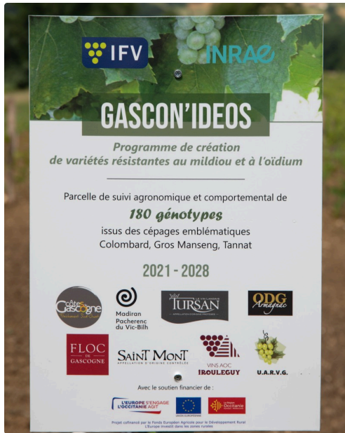
Panneau Gascob'Ideos de la parcelle étudiée du domaine de Mons