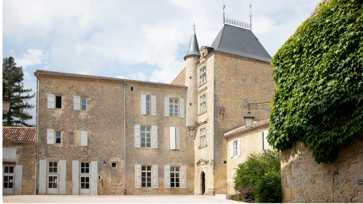
«Gascon'idéos»: créer des plants de vigne alliant résistance et typicité gasconne

Un programme de l'Institut national de la recherche agronomique et de l'Institut français du vin