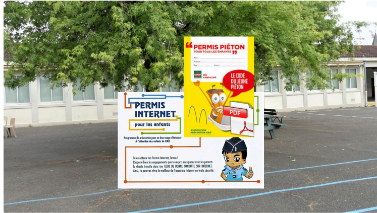
Permis piéton et permis internet pour les élèves de l'école Jean Jaurès de Pavie