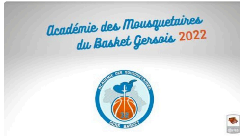
Logo Académie des Mousquetaires Gersois.