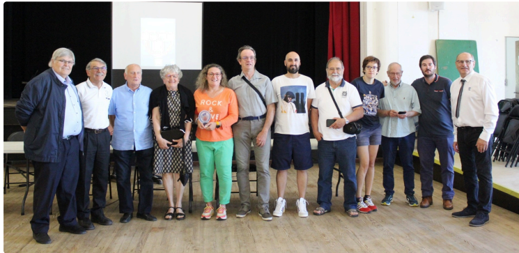
Récemment créée, la nouvelle Académie des Mousquetaires du basket gersois a dévoilé la première promotion