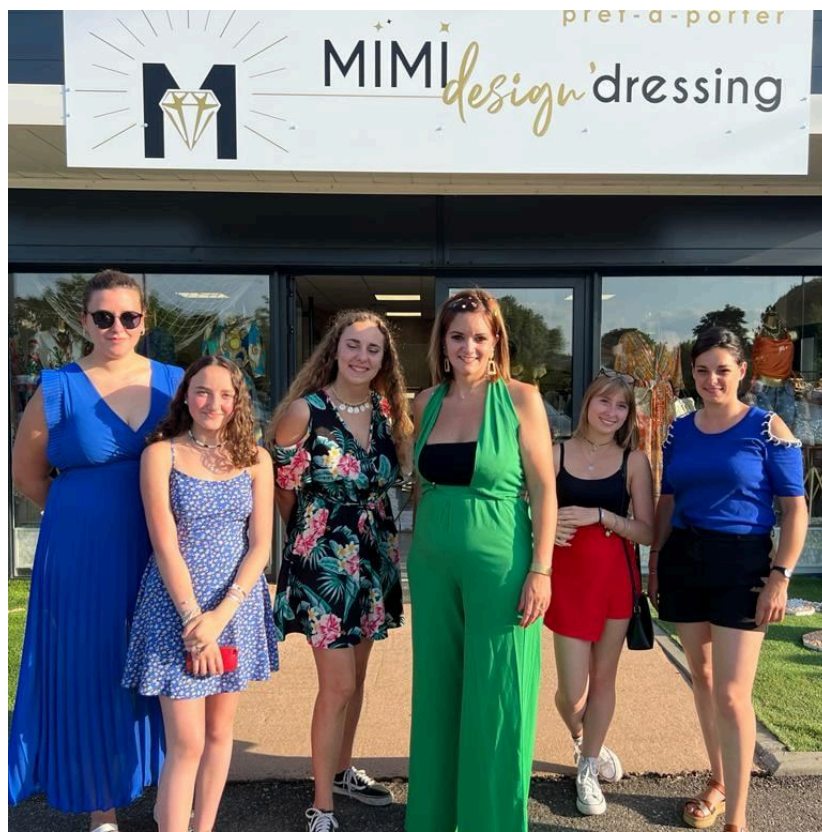
Une boutique spacieuse, lumineuse, à l'ambiance chaleureuse et conviviale.