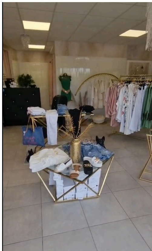
Une collection colorée, vitaminée, des styles variés et de petits prix.