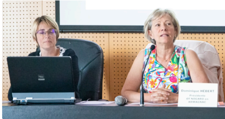
L'Office de tourisme de Nogaro entre dans l'Office de tourisme de Pays

Il laisse la place à l'association «Les Amis du vélorail de l'Armagnac»