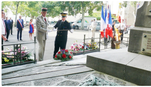
Ravivage de la flamme.