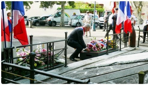
Le député, Jean René Cazeneuve, a déposé une gerbe.