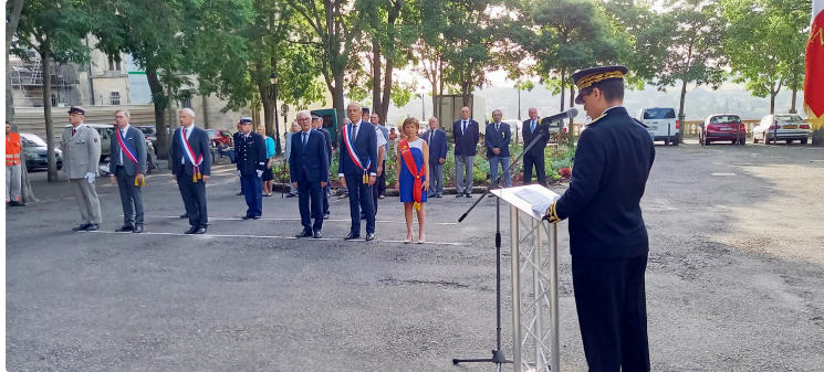
Cérémonie de l'appel du 18 juin

A l'occasion du 82ème anniversaire de l'appel à la résistance du Général Charles de Gaulle lancé depuis Londres le 18 juin 1940, une cérémonie s'est déroulée au Monument aux morts d'Auch samedi en tout début de matinée. Il s'agissait de se souvenir de l'appel lancé sur les ondes de Radio-Londres où le Général de Gaulle appelait les Français à refuser la défaite et à poursuivre le combat aux côtés de nos alliés Anglais qui résistaient vaillamment aux armées hitlériennes.