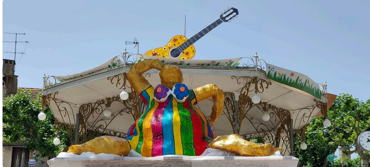
Label de Nuit a fêté ses 10 ans autour de La Belle de Nuit !

Créée en janvier 2012 à Vic-Fezensac, l'association Label de Nuit, association d'animation culturelle intergénérationnelle fêta samedi ses 10 ans.