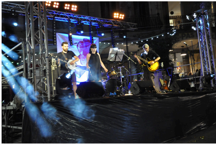
...The Projet Newton, un cabaret rock swing...