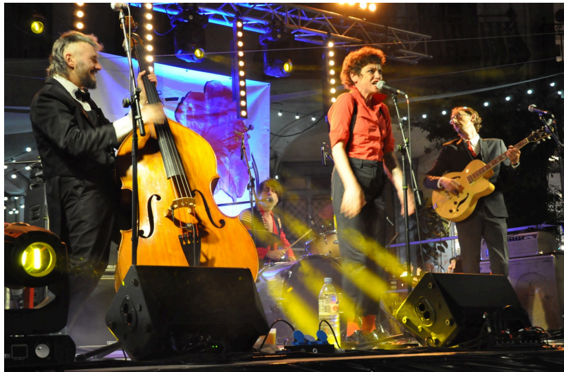
...The Grav's, du blues punk...