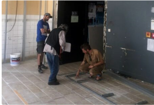
le Sénéchal s'embellit

En accord avec l'association ciné 32 qui les attendait avec impatience, des travaux ont été engagés à la Salle du Sénéchal – Cinéma de Lecture – pour agrandir le Hall d'Accueil.