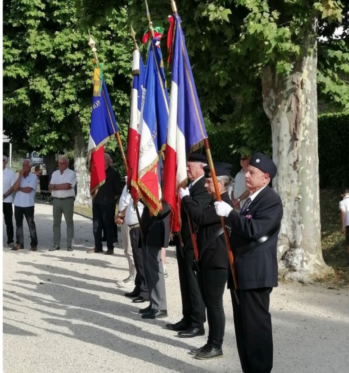
Ne pas oublier

Le 82ème anniversaire de l'appel à la résistance du Général Charles de Gaulle lancé depuis Londres le 18 juin 1940 a été commémoré samedi à Mirande en tout début de matinée en raison des fortes chaleurs annoncées. Il s'agissait de se souvenir de l'appel lancé sur les ondes de Radio-Londres où le Général de Gaulle appelait les Français à refuser la défaite et à poursuivre le combat aux côtés de nos alliés Anglais qui résistaient vaillamment aux armées hitlériennes.