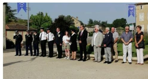
mirande 18 6 3.JPG

Une cérémonie toute simple mais, qui en ces temps perturbés, revêtait un caractère plus prégnant .