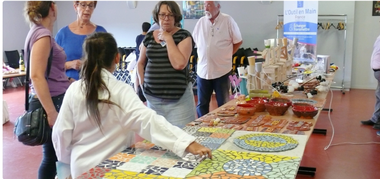
Une après-midi de prestige pour les enfants de "L'Outil en main"

Ils ont présenté leurs oeuvres à l'Ecole des métiers