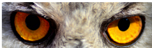
sortie scolaire Madiran