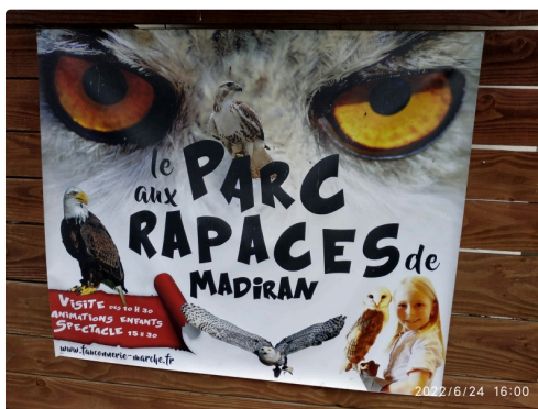
affiche du parc