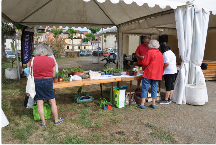
Natura'Vic, une belle édition estivale au plus près de Dame Nature

Samedi matin, aux abords de la salle polyvalente, les trois chapiteaux qui reçoivent Natura'Vic dans sa version estivale sont dressés avec leurs installations pour cette 2ème édition organisée conjointement par le centre social Vic Accueil et la mairie de Vic-Fezensac.