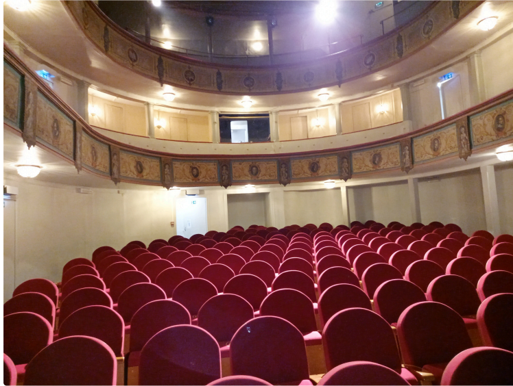
Salle Cuzin, une journée au théâtre

La Cie auscitaine Sassafras propose deux pièces de théâtre et un intermède médical