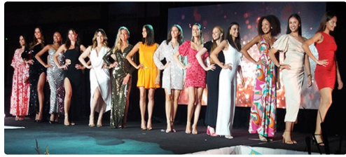
miss gers présentation.jpg

Les huit Miss élues sur le territoire de l'ancienne région, Midi-Pyrénées et leurs premières dauphines, concourront le 3 septembre à Villemur sur Tarn pour tenter de décrocher la couronne régionale, et, pouvoir ainsi poursuivre leur aventure vers le titre tant convoité de Miss France. Le rendez-vous est déjà pris pour l'élection 2023.