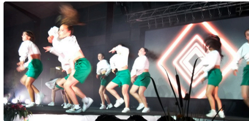
miss gers spectacle.jpg