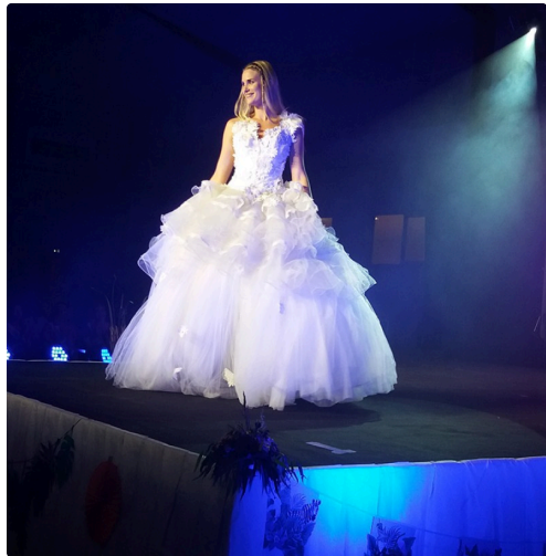
miss gers mariee robe 2.jpg