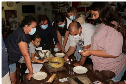
3556_MUSEE Paysan Emile_EscapeGame_29-7-2021.JPG

15, arrua Marceau - 32000 Aush - media.gasconha@gmail.com