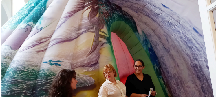
Memento, quinze artistes participent à l'exposition "Résidence secondaire"

Mercredi 6 juillet ouvre la programmation de la série "Les mercredis de Memento"