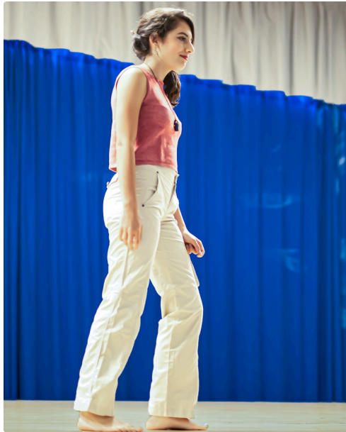
3 Mannequin 1bis 250622.jpg