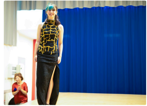
5 Mannequin 1bis 250622.jpg