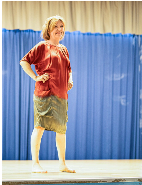
1 Mannequin 1bis 250622.jpg