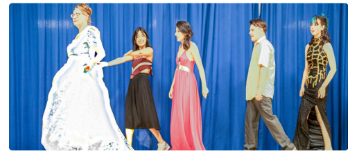
00 6 mannequins.jpg