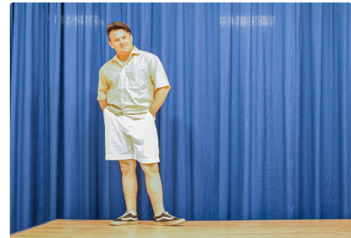
2 Mannequin 1bis 250622.jpg