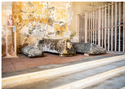
Sarcophages à l'entrée de l'église