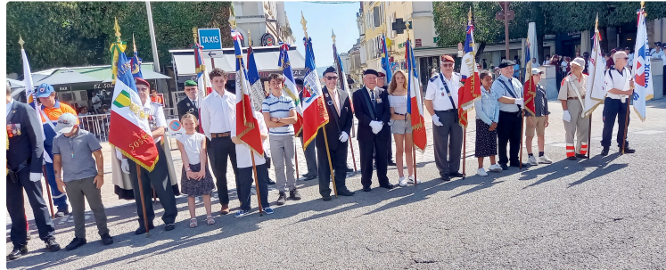
Cérémonie du 14 juillet : une certaine solennité devant un public plutôt confidentiel

C'est sous un soleil de plomb, il fallait s'y attendre ce jeudi 14 juillet sur le coup de 11 heures, que se déroula place de la Libération, la commémoration de la fête nationale. Celle-ci fut suivie par un public plutôt confidentiel, ce qui n'empêcha pas de lui donner une certaine solennité.