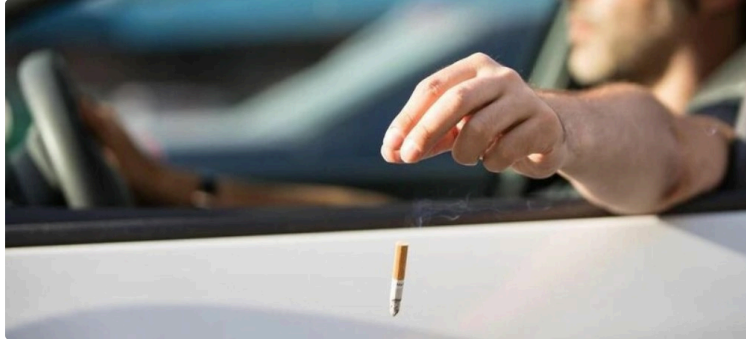
Mégot de cigarette jeté depuis sa voiture = départ de feux !

Le maire de Langlade, petite commune du Gard, a pris un arrêté interdisant aux automobilistes circulant sur sa commune de fumer au volant.