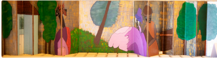
«La Chrysalide» expose à Aignan

La Chrysalide expose des toiles, des émaux et des sculptures jusqu'au 30 juillet, le matin du lundi au vendredi jusqu'au 30 juillet 2022 à la salle de l'ancienne gendarmerie, place Colonel-Parisot.