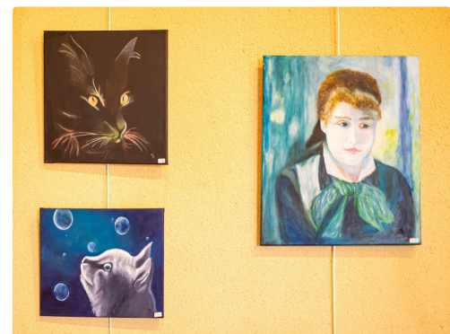
Chats et jeune fille