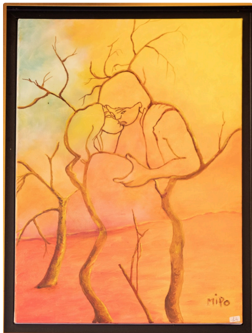
2 Mipo Les Amoureux 1bis 150722.jpg

N.B. - Sur la photo du haut de page : petit paravent "Voilà Paquin" de Catherine Crouch.