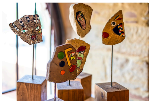
Pierres et émaux grand feu