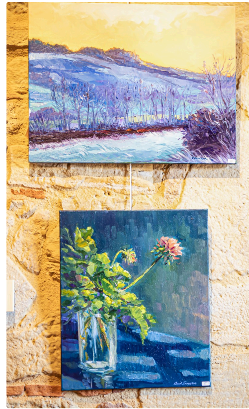
11 2 tableaux 1bis 150722.jpg