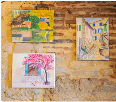
3 tableaux dont, à droite : Rue de l'île de Ré