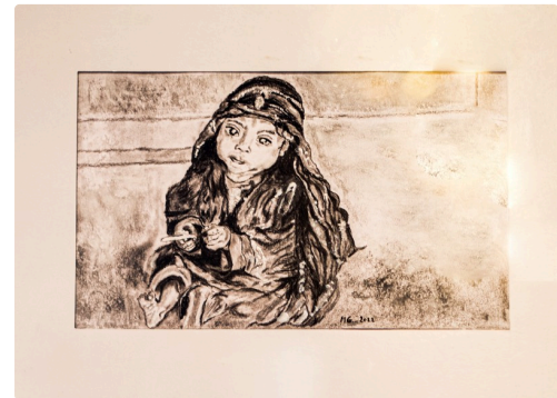
Pastel (c'est un sous-verre, d'où des reflets à droite...)